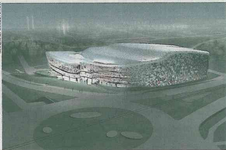
Centrum Kongresowe przy rondzie Grunwaldzkim, projekt: Ingarden&Ewy Architektki wraz z Arata Isozaki & Associates